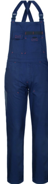
80 – BLUE/GREY