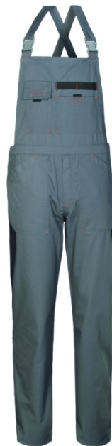
GY – GRIGIO/NERO