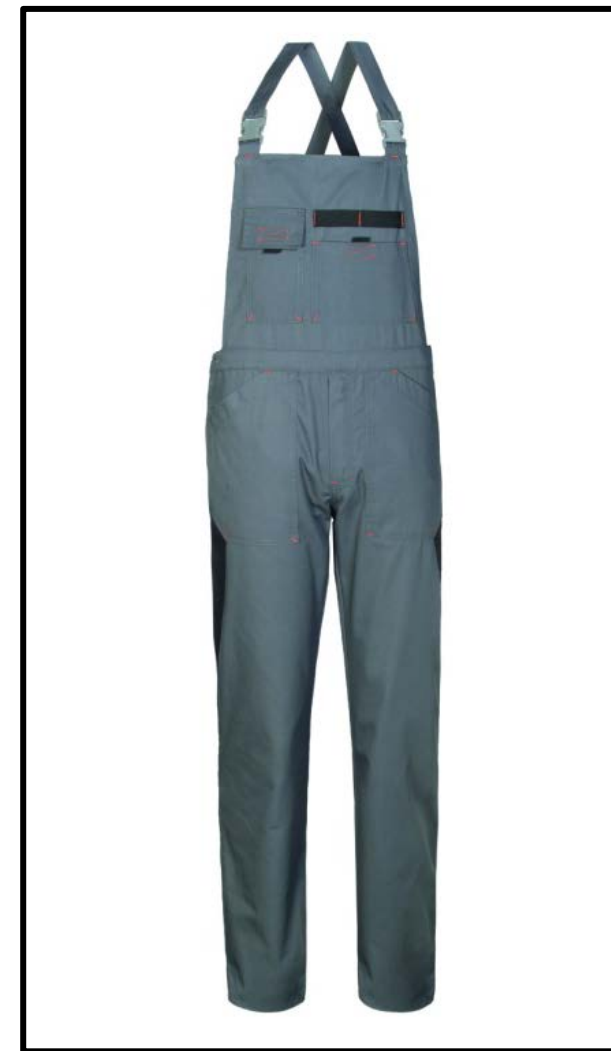
GY – GRIGIO/NERO