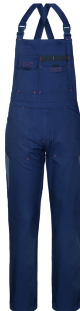
80 – BLU/GRIGIO