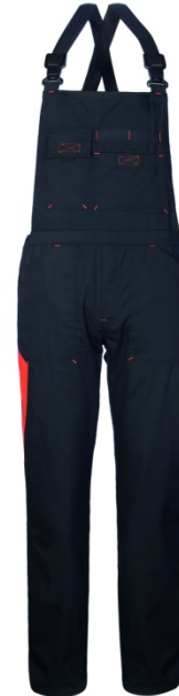
64 – NERO/ARANCIO